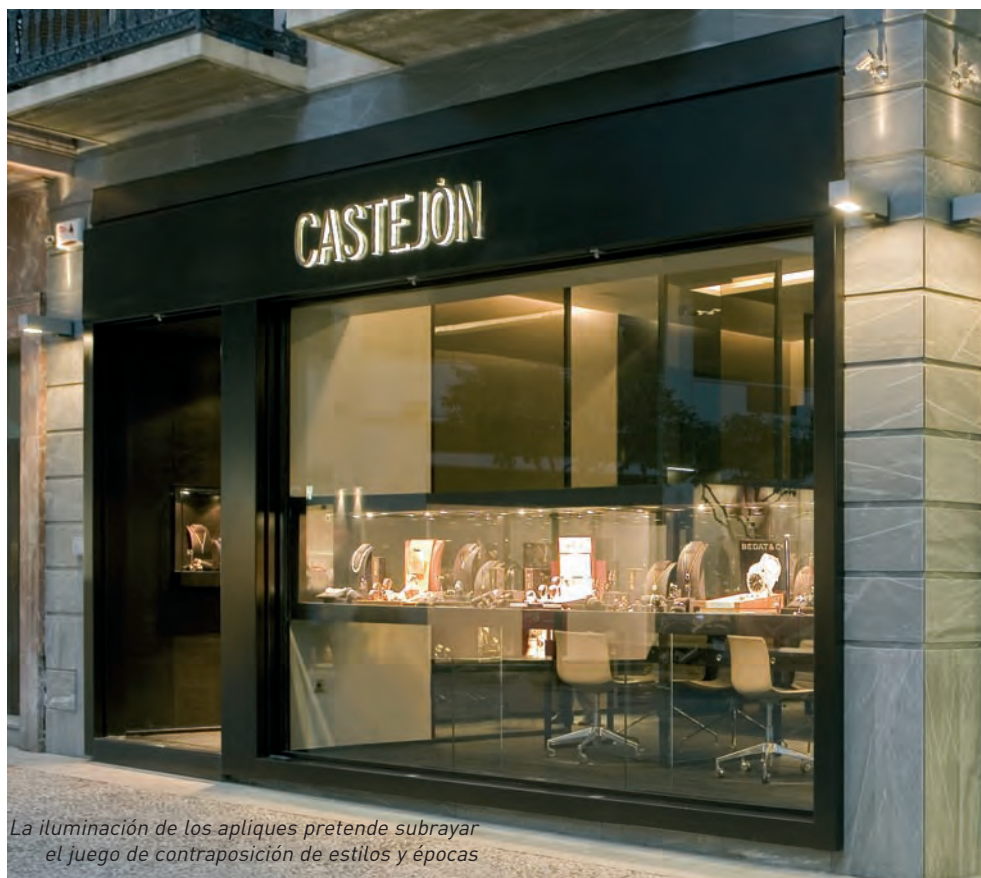
La iluminación de los apliques pretende subrayar el juego de contraposición de estilos y épocas