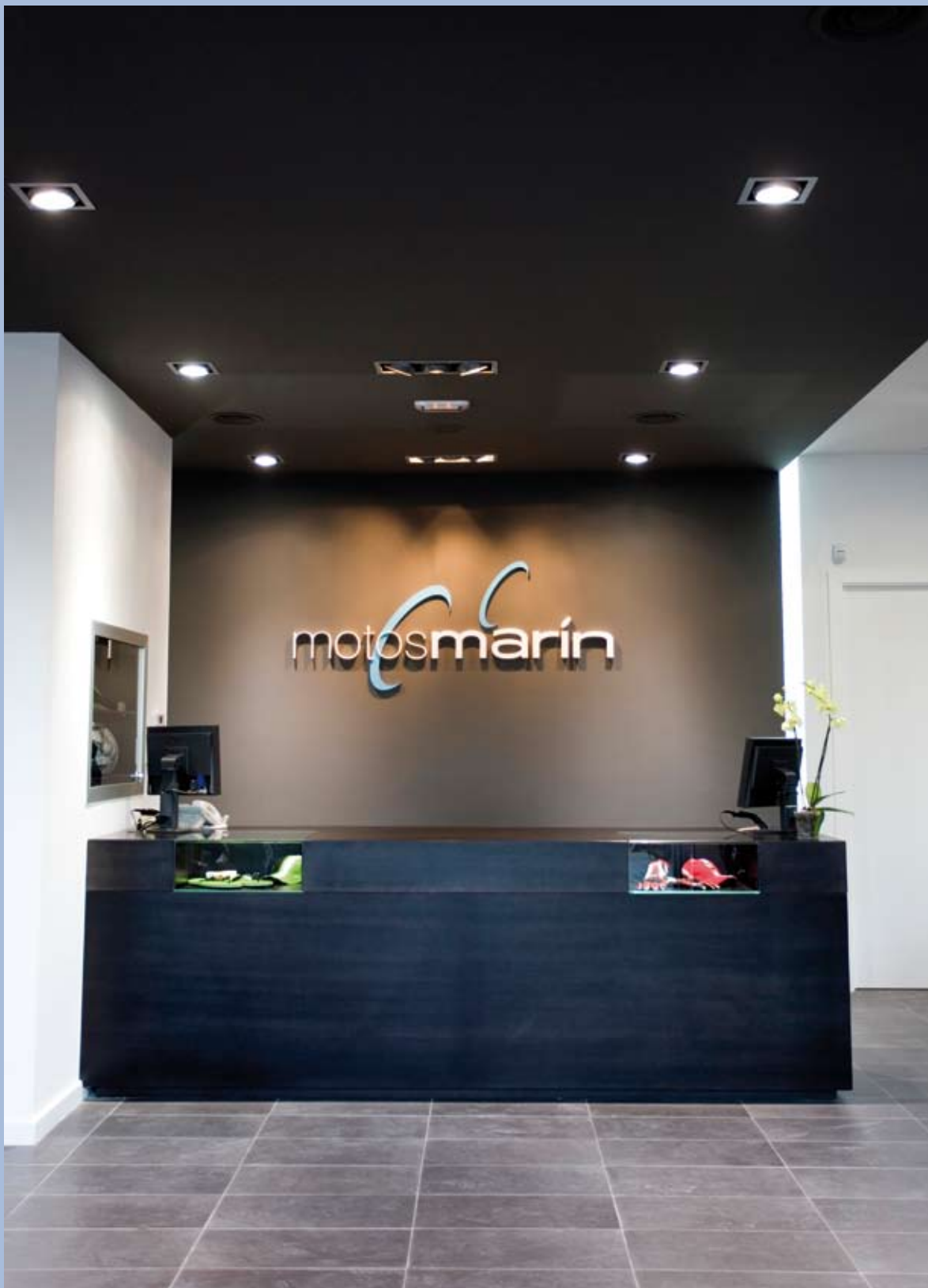
Mostrador de atención al cliente de Motos Marín.