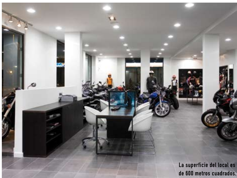
La superficie del local es de 600 metros cuadrados.